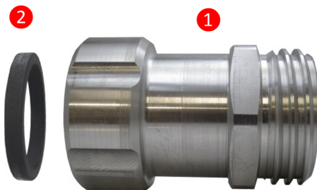
Figur 1 Grundteil KA60-V Bestell-Nr. 1301810